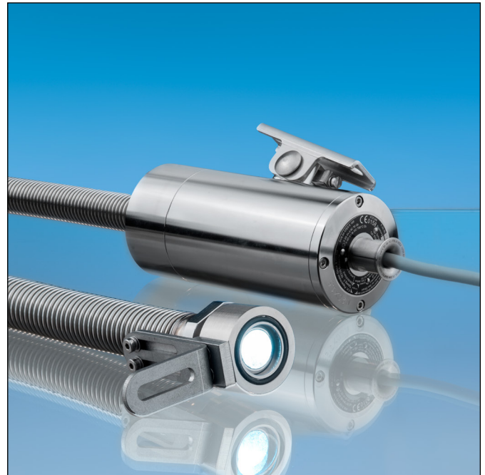
Lumistar-Leuchte 'Lumiflex' ESL55LED-ALF-Ex