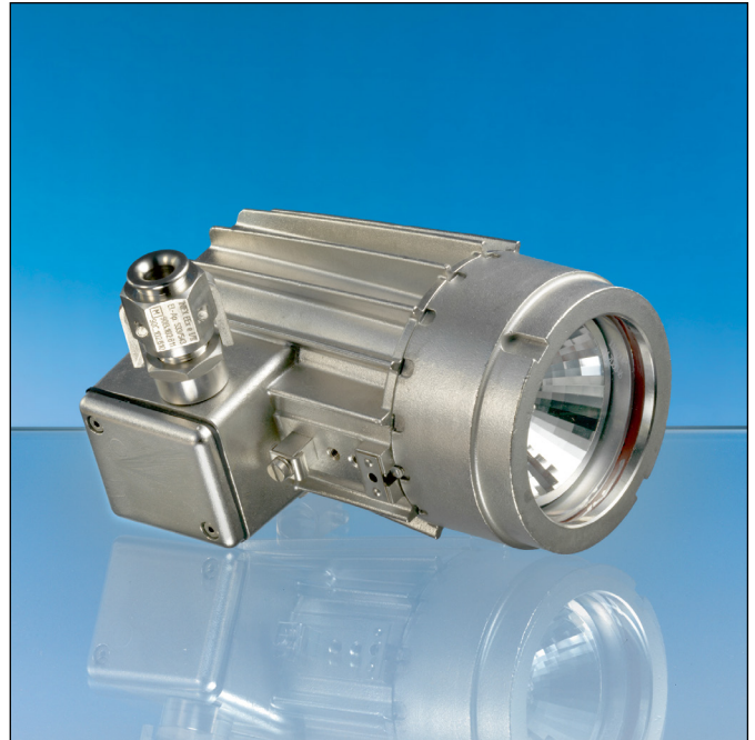
Lumistar Leuchte ESL 26-Ex, Edelstahl