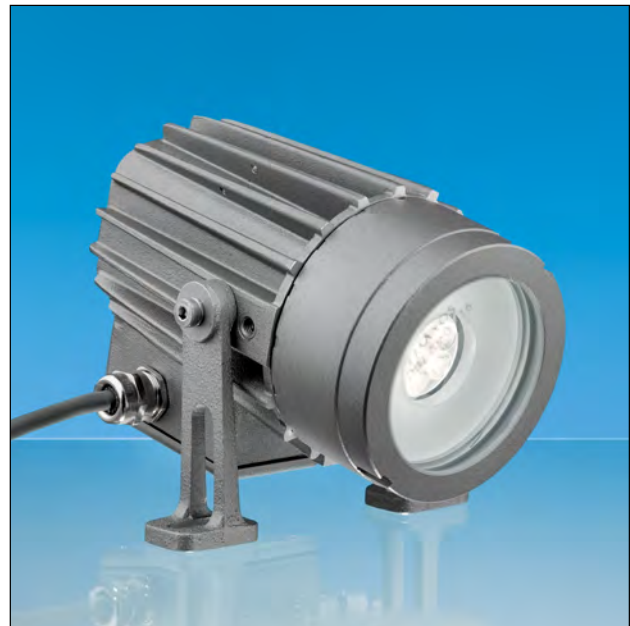
Lumistar Leuchte USL 07 LED-Ex mit Anschlusskasten