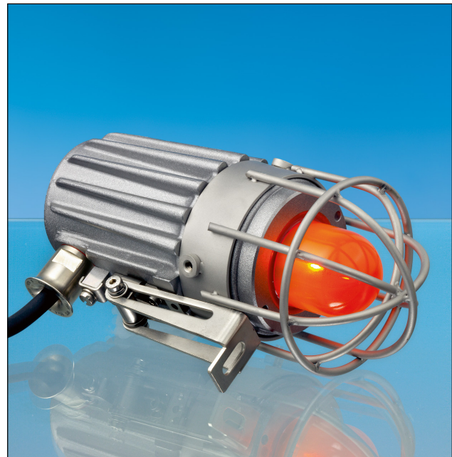
Lumistar Ex-Blinkleuchte USL 45A-Ex mit Zubehör: Schutzkorb aus Edelstahl und Klappscharnier