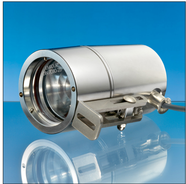
Lumistar Leuchte ESL 27-Ex mit Klappscharnier